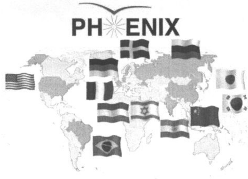
2. ábra. A PHENIX-együtműködésben résztvevő országok a világ térképén.

Tekintsük röviden át ezeket, a mai kísérleti nagyenergiás részecske- és magfizika világszínvonalát meghatározó mérőeszközöket.